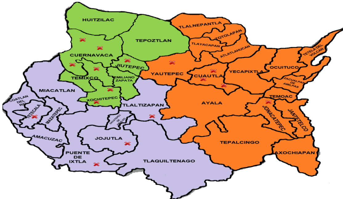
Cuadro ilustrativo que representa los servicios de asesoría jurídica, patrocinio judicial, atención psicológica, por Municipio, que brinda la Fiscalía de Apoyo a Víctimas y Representación Social